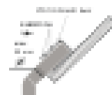
Схема крепления / подключения